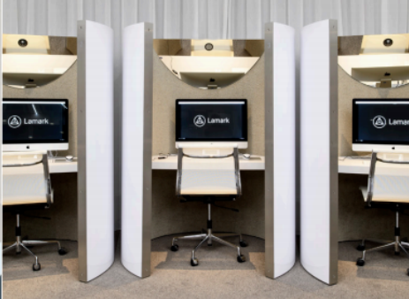
RUIE EN VEILIGE WERKPLEKKEN