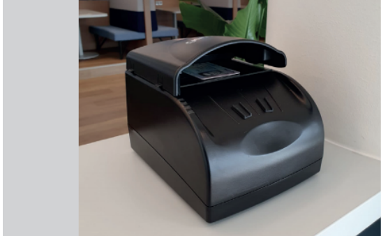
OBJECTIEVE EN VEILIGE ID CONTROLE